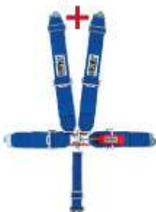
Sporta drošības jostas