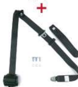
Standarta drošības jostas

Drošības lokam jābūt nostiprinātam pie virsbūves ar skrūvētu vai metinātu savienojumu