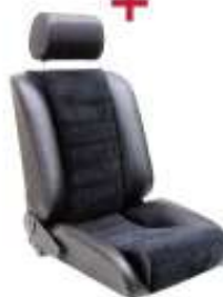
Sēdeklis ar regulējamu atzveltni