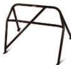
Skrūvējamais nepilnais roll cage vai bez drošības karkasa