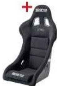
Kausveida sporta sēdeklis